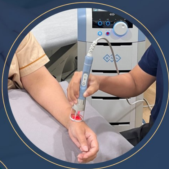
กายภาพบำบัด ด้วยการใช้เครื่องมือ เพื่อลดอาการอักเสบ