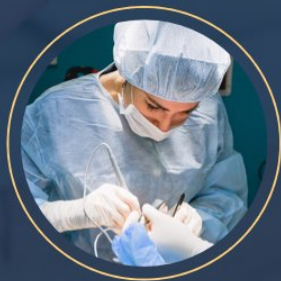
การผ่าตัด